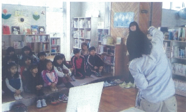
社台小学校での講話