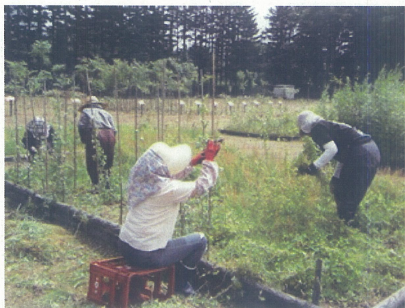
野草園の除草作業(森野地区)