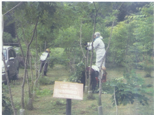
樹木の剪定(森野地区)