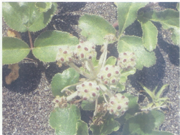
生育したハマボウフウ(ヨコスト)