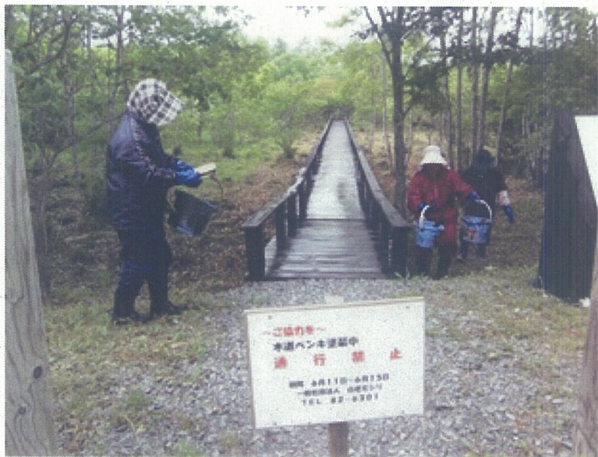
木道防腐処理(ポロト地区)

陣屋地区においては、昨年度実施した生育調査の結果から、土嚢を積み水を堰き止めることで少しでも水位を保つ工夫をするほか、除草作業をする箇所、しない箇所を分けて生育状況の推移を観察することとした。