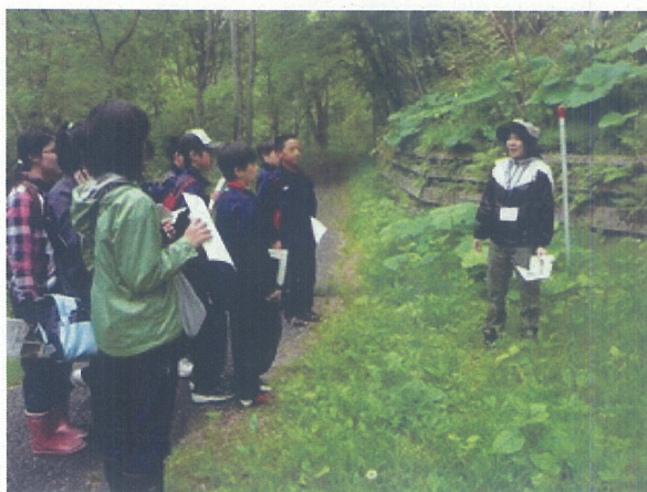
竹浦中学校「山菜学習」