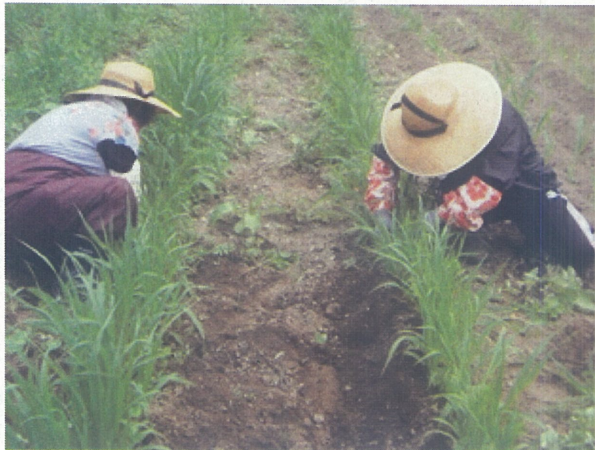
キビの間引き作業(森野地区)