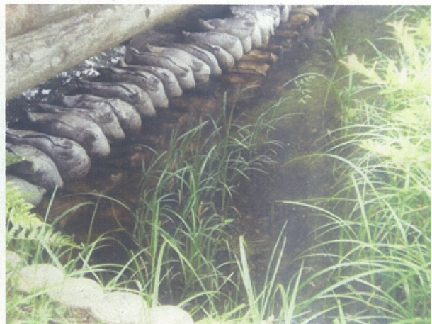
土嚢積作業(陣屋地区)