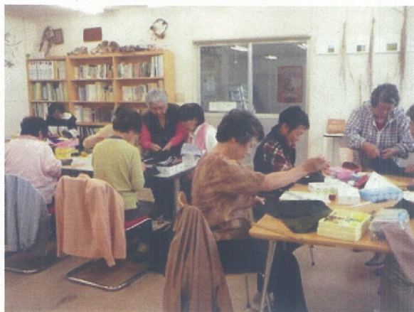
ティッシュケース作り