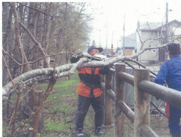
枝払い作業(ポロト地区)