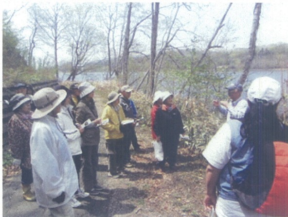
山のイオル「山菜学習」

アイヌ文化の体験・体感交流事業は、教育現場でのアイヌ文化の理解・普及促進を図るため、教職員を対象に体験学習、研究者・学芸員による講義など3日間6講座を実施した。